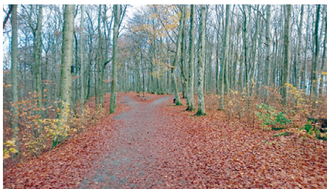
Bøkeskogen i Larvik, der man ser at turstien går oppover i skogen og deler seg i en sti til venstre og en til høyre. Hvilken skal man velge?