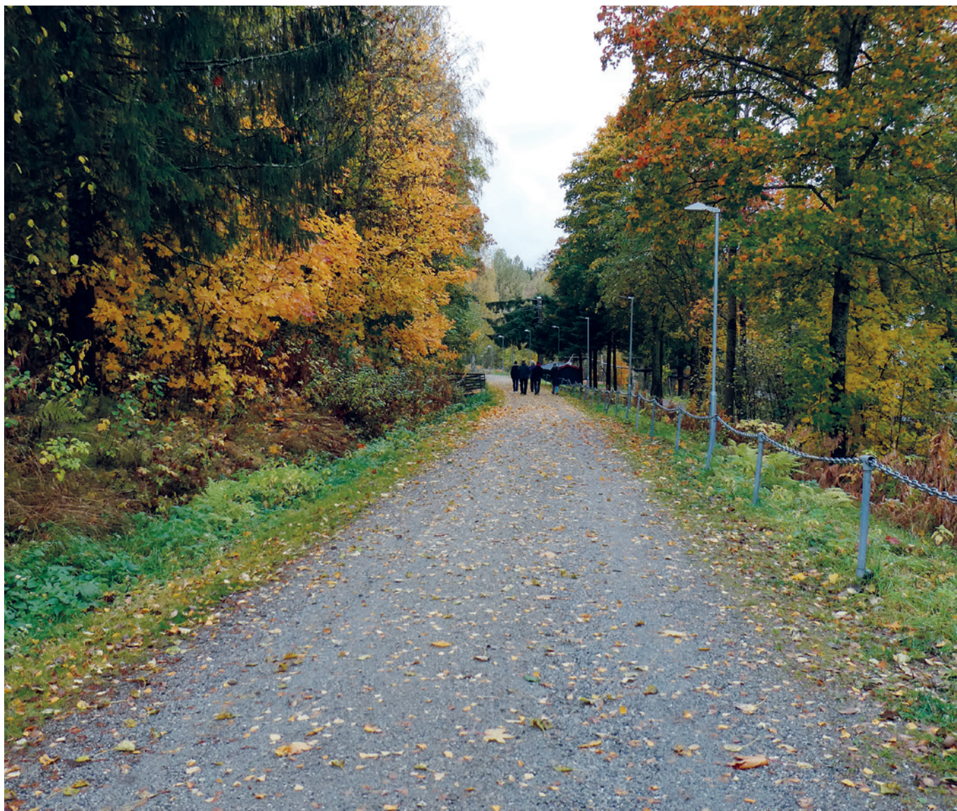
Bakken ned fra senteret i høstdrakt. En av gruppene som er på tur helt nederst i bakken.

på Hurdalsenteret, og opplever at det kan være ekstra utfordrende å overbevise personer med RP om å ta mobilitetsstokken i daglig bruk. Vi håper at noen ble mer motivert til dette etter å ha hørt på Cato.