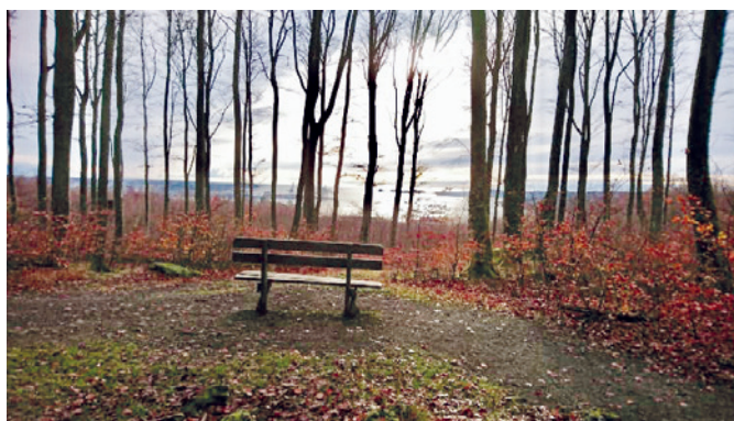
Bøkeskogen i Larvik, en av flere benker som er plassert i skogen – her ser man utover mot havet gjennom flott høyreist bøk. Her kan man virkelig la en pust i bakken bli et øyeblikk.

Fikk du ikke anledningen til å følge det fine Vinn – Vinn samarbeidet denne helgen, er det ny mulighet allerede 10. – 12. desember på Mesnali ved Lillehammer. Ta da kontakt med hakongis@gmail.com for påmelding. Program ligger på foreningens nettsider www.rpfn.no .