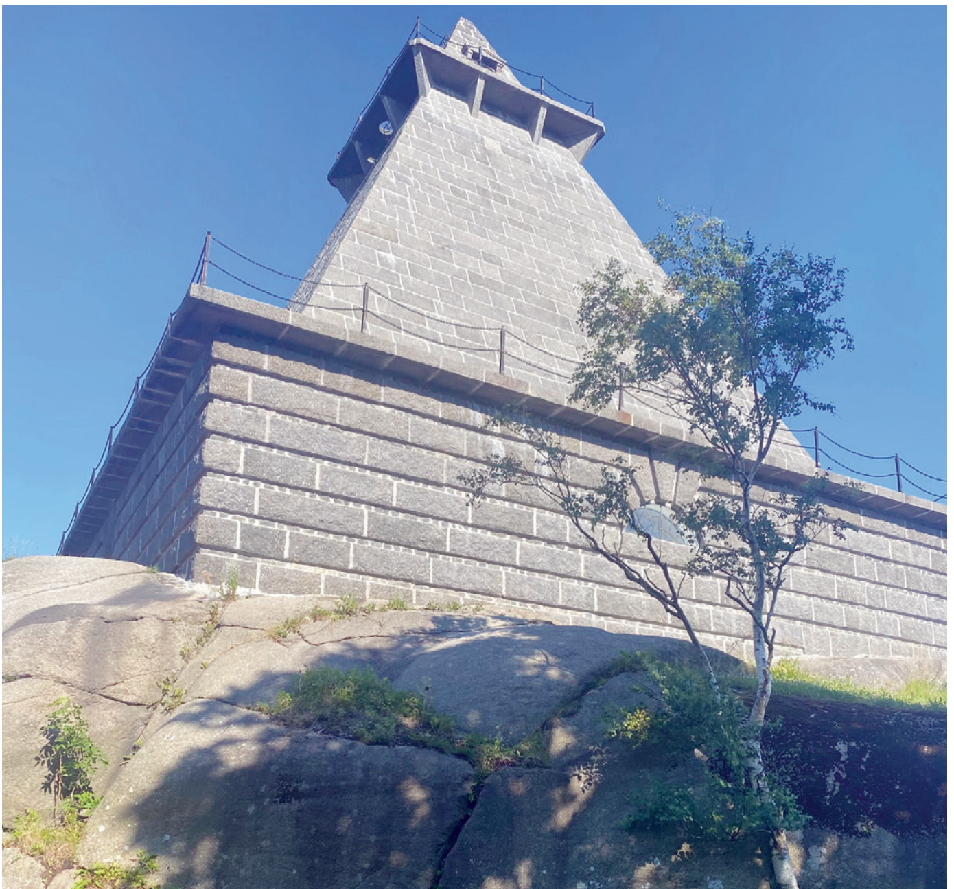
Kruttårnet i Stavern, bildet er tatt nedenfra og viser et imponerende tårn i grå stein fra en spennende vinkel der tårnet bare blir mindre og mindre mot himmelen.

I tillegg til at dette var foreningens årlige turhelg, var også våre venner fra Tyrili invitert som et ledd i Vinn – Vinn 2021. Totalt 60 deltagere fant veien til Stavern folkehøyskole.