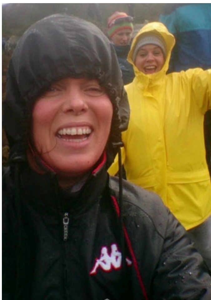
Store smil og godt humør er alltid med på tur med RP-foreningen!"