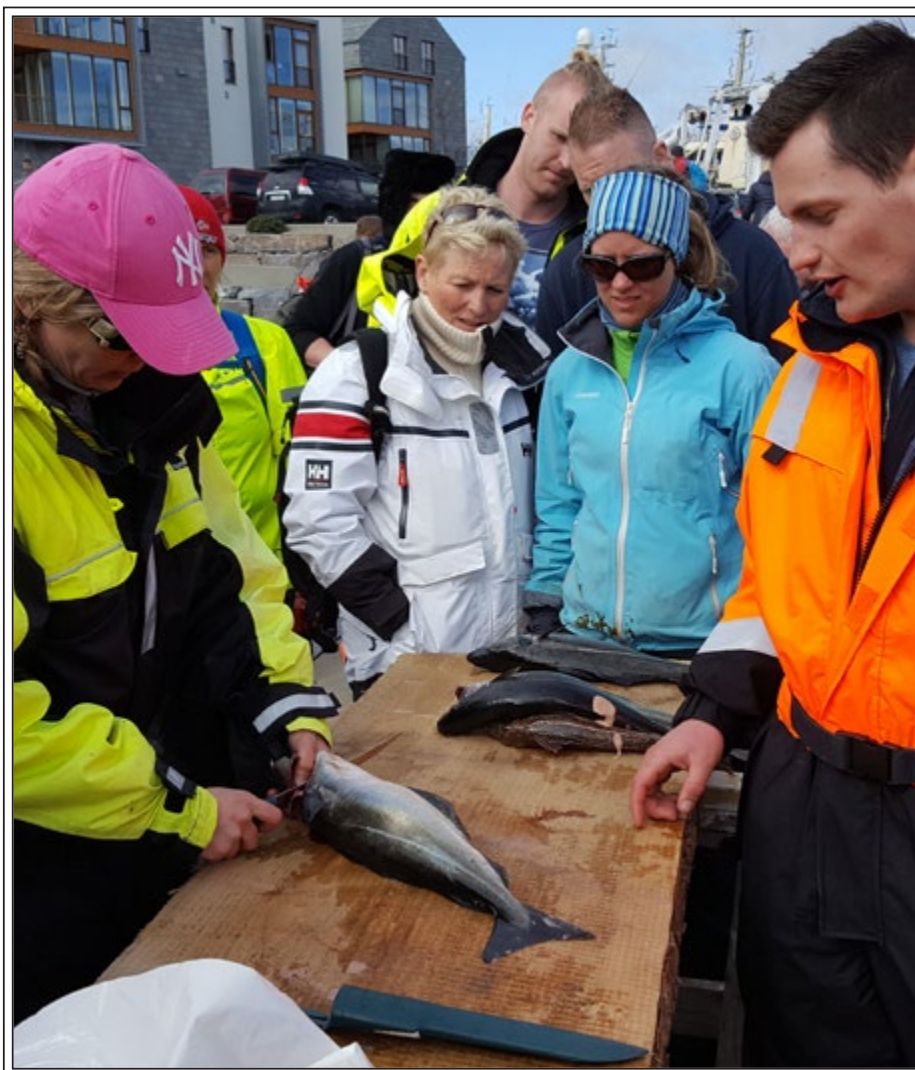
VINN-VINN-prosjektet: Rp-foreningen dro til Bergen på havfisketur med Tyrili

Dette bladet er utformet for å være lesevennlig for synshemmede.